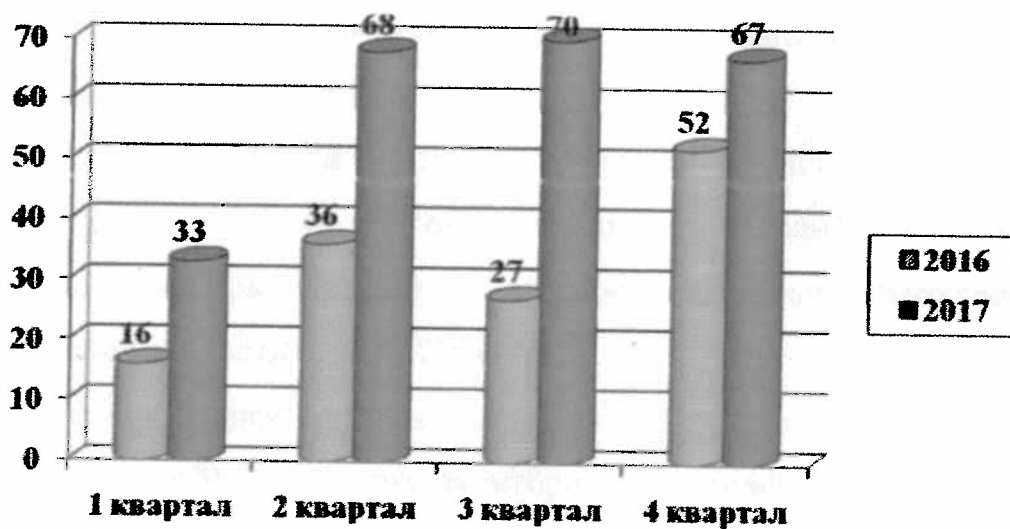
Ежеквартальный объем выдачи ипотечных жилищных кредитов (займов) за 2016 и 2017 годы (ед.).

г.Благовещенск - 79 семьи Благовещенский район - 20 семей Бурейский район 21 семья г.Завитинск - 1 семья Зейский район - 1 семья Ивановский район - 25 семей Константиновский район - 7 семей Магдагаченский район - 1 семья Михайловский район - 4 семей Октябрьский район - 1 семья п.г.т.Прогресс - 15 семей г.Райчихинск - 30 семей Серышевский район - 2 семьи г.Свободный - 2 семьи г.Сковородино - 1 семья Тамбовский район - 6 семей г.Тында - 2 семьи г.Шимановск - 18 семей.